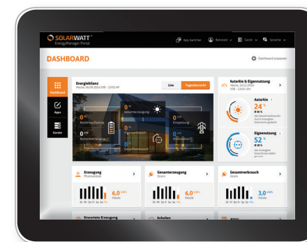
EnergyManager Portal de SOLARWATT